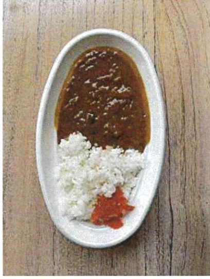
カレーライス 福神漬け