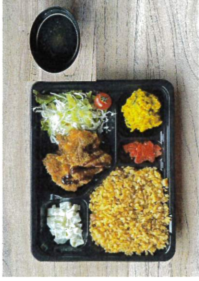
チャーハン コンメスープ 手作りチキンカツ かぼちゃサラダ 福神漬け コーンスロー 野菜サラダ

※ご飯大盛は+100円です。チャーハンの大盛はできませんご了承ください。 ※事前にご予約頂ければ、常温のお茶（500ml分¥50円）をセルフサービス形式でご用意致します。 ※お味噌汁はセルフサービス形式でご用意致します。