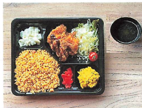
チャーハン コンソメスープ 手作りチキンカツ かぼちゃサラダ 福神漬け コールスロー 野菜サラダ